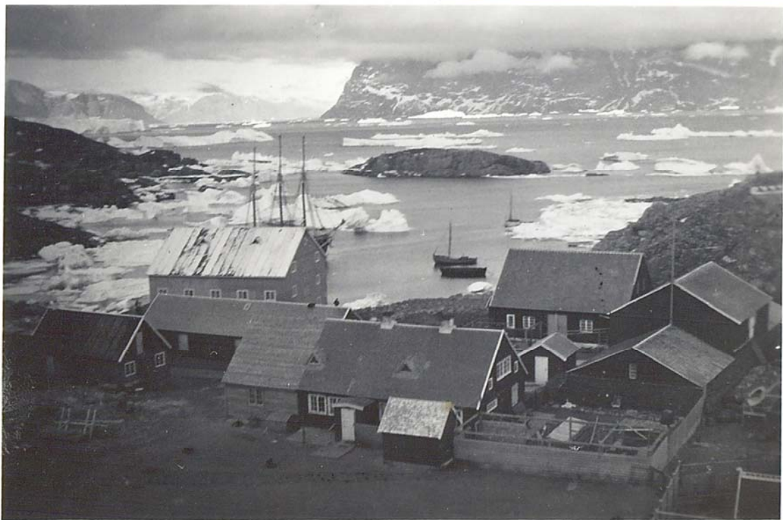
Fyllas 3 master stikker op bag huset