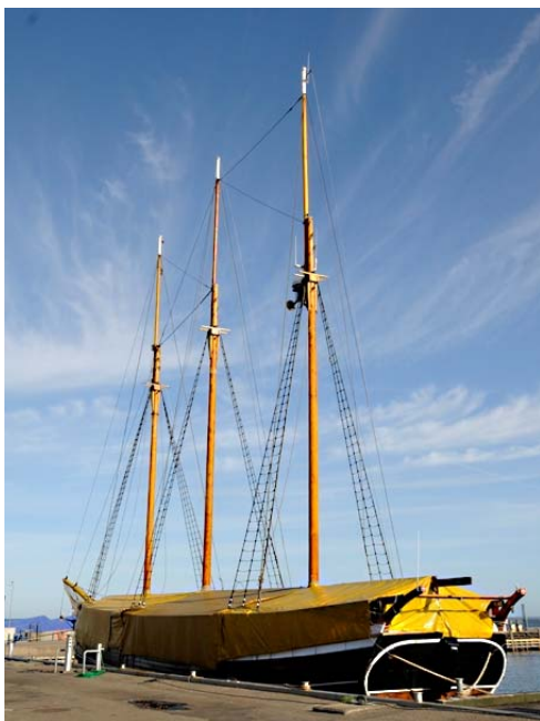
Fylla inddækket for vinteren

Skonnerten er rigget af og ligger og pynter i Ærøskøbing Havn - pakket fint ind i "vintertøjet".